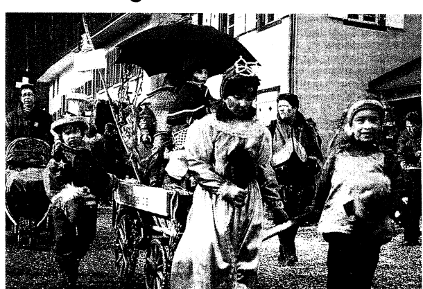
Bunt und froh. Zu den grossen Fasnächtlern gehören die kleinen Lützler. H.D.

Soll die Post in den Huggewald fahren oder nicht? Für die Kinder aus dem Weiler ist das eine beschlossene Sache. Wenn es doch keine Haltestelle