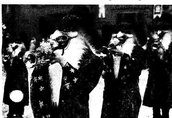
Jubiläum. In Nunningen wurde «30 Jahr Ohrgrübler» gefeiert. Dürrenberger

Nunningen/Hofstetten. tfi. Mit dem Winter vertreiben scheint es geklappt zu haben. Kaum hatten die Guggemusik Ohrgrübler in Nunningen, die ihr 30-Jahr-Jubiläum feierte, als auch die «Glori Moore» in Hofstetten mit ihren schrägen Tönen den Umzug eröffnet, hörte der Regen auf und die dunklen Wolken machten der Sonne Platz. In kurzer Zeit hatten die zahlreichen Cliquen und Guggenmusiken mit einem