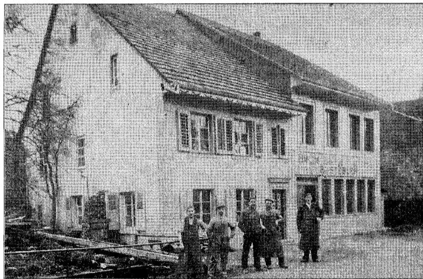
Erste Werkstatt vor 125 Jahren.

Innovatives Unternehmen in modernen Räumen.