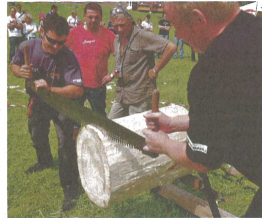
Zupacken. Auch beim Wettsägen war Zimmermannskunst gefragt.