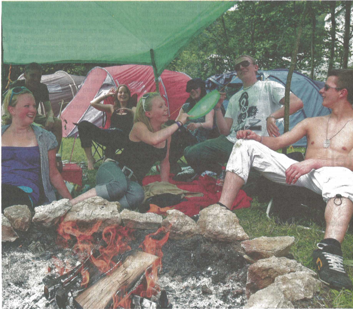
Hauptsache gemütlich. Trotz Regengüssen zelebrierten die Schwarzbuben das Open-Air-Leben.

Nunningen. Mit Improvisationsgeschick retteten Helfer das Open Air