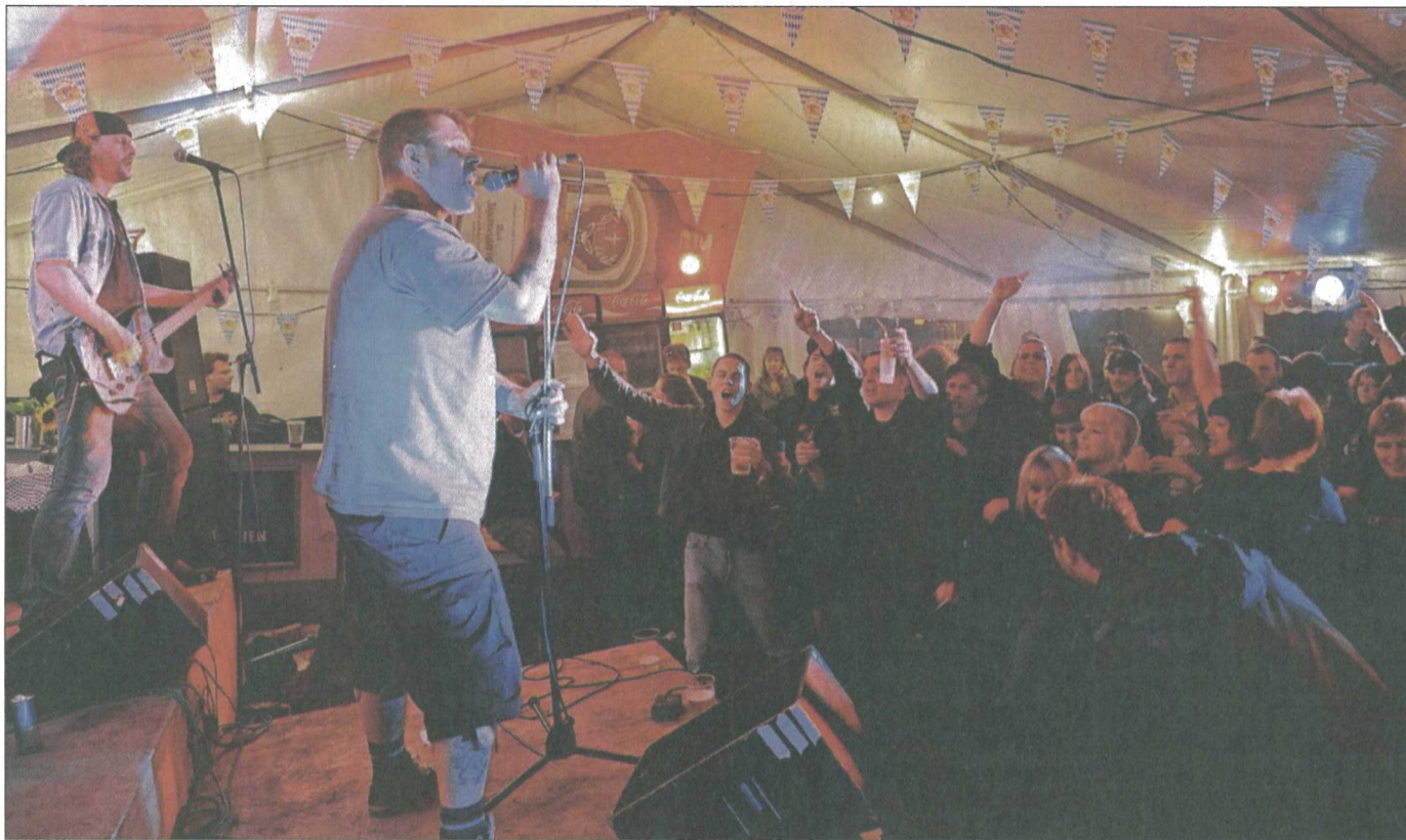
IMPROVISATIONSKUNST Die deutschen Dimple Minds rocken in der eiligst hergerichteten Bühne im Bierzelt.